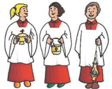
(Grafik: Birgit Seuffert, Pfarrbriefservice)

Unsere Ministrantinnen und Ministranten, sowie Pfarrer George freuen sich darauf, mit dir zusammen zu arbeiten und dich bald in unserer Gemeinschaft begrüßen zu dürfen! (Anmeldeformulare gibt es in der Sakristei)